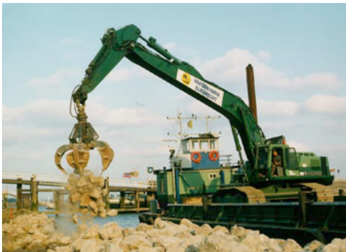
Foto 2 oeverwerk, ook met milieu-eisen

Waterbouwers hebben bij de bagger- kust- en oeverwerken, met alle milieucompartimenten te maken. Bedrijven hebben daarbij zowel intern (Bedrijfsinterne Milieuzorg, BIM) als extern (projecten) met milieuregels te maken. De interne milieuzorg wordt geregeld in de Milieuvergunning op grond van de Wet Milieubeheer. De interne milieuzorg voor binnenschepen en zeeschepen wordt in aparte wetgeving geregeld. Bij de uitvoering van projecten heeft men eveneens met milieuregels te maken, die in de projectvergunning zijn opgenomen. Als een project een saneringsproject is, heeft de opdrachtgever tot doel een milieuverbetering op een locatie te bewerkstelligen en zal het uitvoerende bedrijf zowel op milieuregels als arboregels moeten letten. De opdrachtgever stelt daarbij strenge eisen voor de saneringswerkzaamheden (Afgraven, zuiveren, storten).